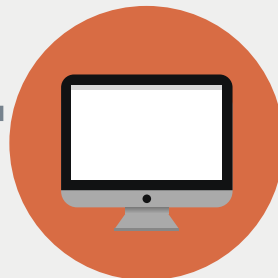
ОПЕРАТОР ПОИСКОВОЙ СИСТЕМЫ